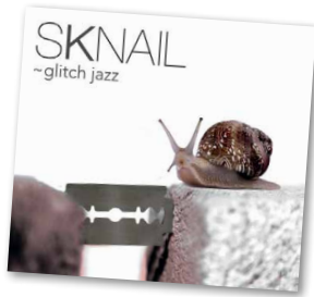
une musique et des sons vierges de toute influence personnelle. A découvrir! R. Roger Jaunin

ou l'autre de ses complices, que chaque instrument a fait l'objet de sa propre prise, sorte de duel entre l'homme et la machine, et que Blaise Caillat, initiateur de ce projet, en a assuré seul et dans le secret de son propre studio l'ensemble du mixage. Guitariste lui-même (Ultra Diez), ce musicien lausannois n'apparaît sur aucun des douze titres que contient l'album. Un choix – pas forcément le plus simple – mais sans doute une manière de prendre un maximum de recul pour, au final, obtenir